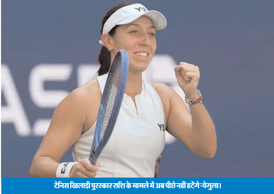
टेनिस खिलाड़ी पुरस्कार राशि के मामले में अब पीछे नहीं हटेंगे-पेगुला।