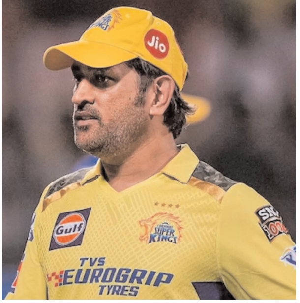
हुए देखना चाहते हैं। फैंस की चाहत है कि अगर वो मैदान पर नहीं उतर सकते तो कम से कम टीम के किसी मैच में मौजूद रहें।

मुम्बई। चेन्नई सुपर किंग्स (सीएसके) टीम के पूर्व कप्तान महेंद्र सिंह धोनी ने अब तक इस सत्र में एक भी मैच नहीं खेला है पर वह शुरुवार को लखनऊ सुपर जायंट्स के खिलाफ होने वाले मैच में खेल सकते हैं। इसका अंदाजा धोनी के टीम के साथ उड़ान भरने को लेकर लगाया जा रहा है। ऐसे में अगर वह खेलते हैं तो इस सत्र में उन्हें खेलते हुए देखने का प्रशंसकों का सपना पूरा हो सकता है। धोनी फिट न होने के कारण शुरुआत से ही बाहर हैं। धोनी अपनी शानदार फिनिशिंग और विकेटकीपिंग के लिए जाने जाते हैं, पिंडली की चोट के कारण वह पूरे सीजन से बाहर रहे हैं। उनके बाहर होने से सीएसके के प्रशंसकों को निराशा हुई है। प्रशंसक उन्हें एक बार फिर खेलते