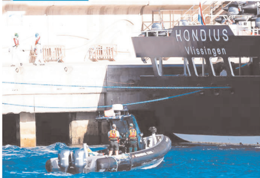
स्पेन के ग्रेनडिला पोर्ट के पास हंतावायरस से प्रभावित समुद्री जहाज एमवी हॉंडियस पर पहुंचे सहायता दल के सदस्य।