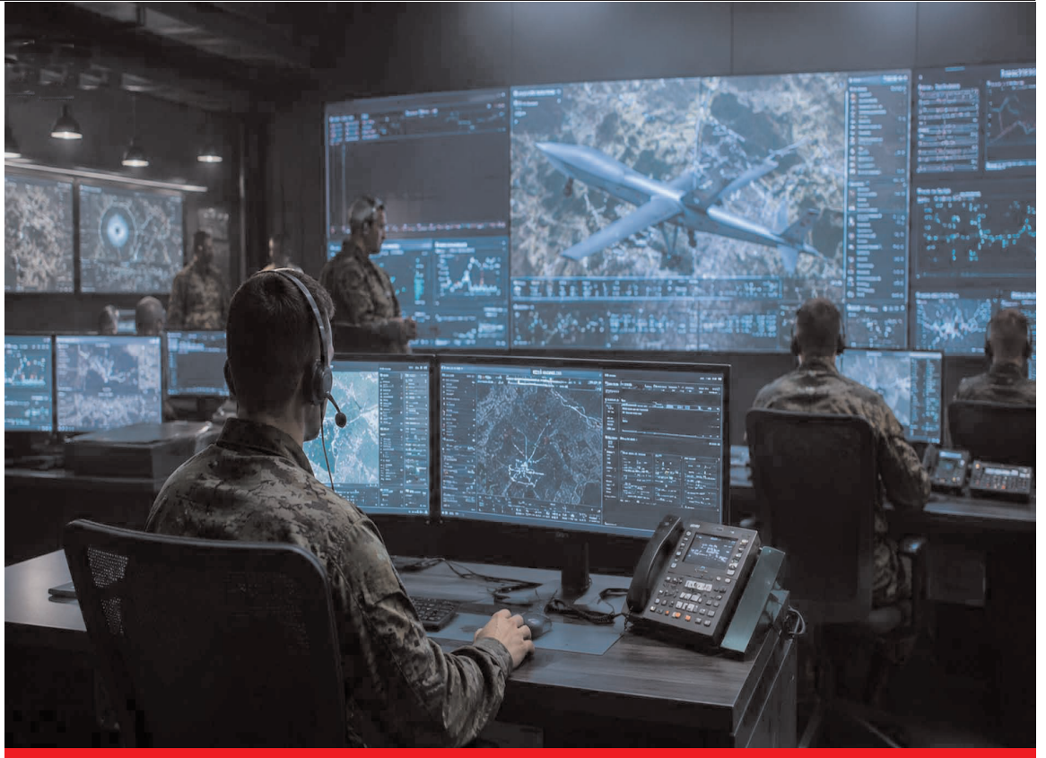
पहले टारगेट को निशाना बनाने घंटों लगते थे, अब ऐसे फैसले सेकंड में होते हैं।

वाशिंगटन। ऑपरेशन सिंदूर को लेकर पाकिस्तान के सैन्य नेतृत्व द्वारा किए जा रहे दावों की हकीकत अब अंतरराष्ट्रीय दस्तावेजों के जरिए सामने आ गई है। पाकिस्तानी सेना प्रमुख जनरल आसिम मुनीर ने दावा किया था कि भारत ने अमेरिका के माध्यम से संघर्ष विराम की पहल की थी, लेकिन अमेरिकी आधिकारिक रिपोर्ट्स ने इस झूठ का पर्दाफाश कर दिया है। रिपोर्ट्स के मुताबिक, 6 मई से 9 मई 2025 के बीच, जब भारतीय सेना आतंकीयों के खिलाफ कार्रवाई कर रही थी, तब पाकिस्तान ने मात्र 88 घंटों के भीतर करीब 60 बार अमेरिकी प्रशासन से संपर्क साधा। इनमें अमेरिकी सांसद, कांग्रेस स्टाफ, रक्षा अधिकारी, ट्रेजरी विभाग और राष्ट्रीय सुरक्षा सलाहकार स्तर के कार्यालय शामिल थे।