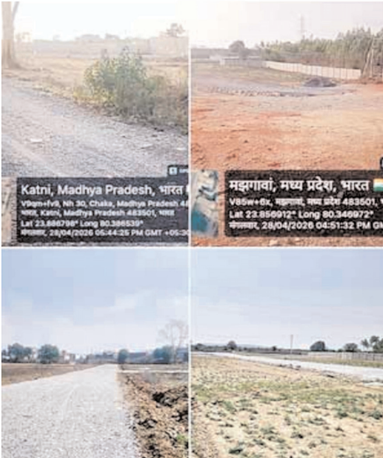
एकड़ क्षेत्र में कच्ची सड़क बनाकर प्लांटिंग का कार्य चल रहा है। इसके अलावा माधवनगर नमक गोदाम के पीछे, तिलक कॉलेज रोड पर पेड़ों की कटाई कर, दुबे कॉलोनी, रपटा पेट्रोल पंप क्षेत्र और निमिया मोहल्ला सहित कई स्थानों पर अवैध कॉलोनिजों का निर्माण तेजी से जारी है। सबसे गंभीर बात यह है कि इन क्षेत्रों में टाउन एंड कंट्री प्लांटिंग, रेरा अनुमति और डायवर्सन प्रक्रिया के बिना ही खुलेआम प्लांट बेचे जा रहे हैं। आरोप है कि कुछ स्थानों पर वन भूमि पर पेड़ काटकर और नालों को पाटकर भू-माफिया करोड़ों का कारोबार कर रहे हैं, और जिम्मेदार विभागों की मूक सहमति बनी हुई है। लोगों का कहना है कि अवैध प्लांटिंग के कारण

कटनी (ब्यूरो)। जिले में शहर से लेकर गांव तक कृषि भूमि प्लांटिंग काटकर अवैध कॉलोनिजों का निर्माण दिलेरी से हो रहा है। अवैध प्लांटिंग का कारोबार लगातार तेजी से फैलता जा रहा है, जिससे शहर से लेकर ग्रामीण इलाकों तक भू-उपयोग नियमों की खुली धज्जियां उड़ाई जा रही हैं। बिना अनुमति कृषि भूमि को कॉलोनिजों में बदलकर और प्राकृतिक नालों को पाटकर प्लांटिंग किए जाने के मामलों ने आम नागरिकों की चिंता बढ़ा दी है। सूत्रों के अनुसार कटनी-जबलपुर हाईवे स्थित कैलवारा खुर्द में एचपी पेट्रोल पंप के सामने लगभग 4 एकड़ क्षेत्र में नाला पाटकर अवैध प्लांटिंग की जा रही है। वहीं अहमदनगर के पीछे करीब 14