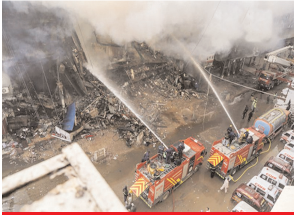
पाकिस्तान में एलपीजी टैंकर में विस्फोट से 35 लोग झुलसे, कई गंभीर।

वाशिंगटन। ईरान के परमाणु कार्यक्रम को लेकर अमेरिका और ईरान के बीच तनाव चरम पर है। राष्ट्रपति डोनाल्ड ट्रंप ने चेतावनी दी है कि ईरान के संवर्धित यूरेनियम की निगरानी अब अमेरिकी 'स्पेस फोर्स' कर रही है। ट्रंप का कहना है कि अगर किसी ने भी वहां पहुंचने की कोशिश की, तो उसे 'उड़?' दिया जाएगा। ट्रंप ने कहा कि अमेरिका, मलबे के नीचे दबे ईरान के संवर्धित यूरेनियम पर लगातार नजर रखे हुए है। मीडिया रिपोर्ट के मुताबिक ट्रंप ने एक इंटरव्यू में कहा कि अगर कोई भी व्यक्ति ईरान के संवर्धित यूरेनियम के पास पहुंचने की कोशिश करेगा, तो अमेरिका को तुरंत इसकी जानकारी मिल जाएगी और उसे उड़ा दिया जाएगा। ट्रंप ने दावा किया कि अगर अमेरिका चाहता।